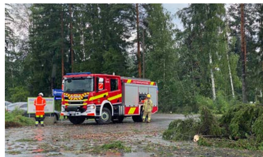
Yllä: Etelä-Savon pelastuslaitoksen Saurus-kalustoa raivaamassa myrskyn tuhoja Mikkelin Pitkäjärvellä.