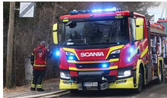
Alla: Omakotitalon tulipalo Turun Korppolaismaässä. Paikalla myös NRG:n pelastusyksikkö laajempia vahinkoja estämässä.